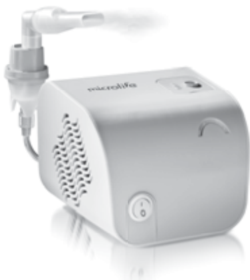
Microlife NEB 100B