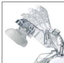
Регулируемый лобный упор: четыре четко обозначенные положения