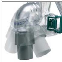
Вращающийся отвод: удобное положение воздушного шланга Компания