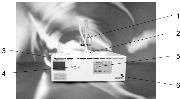
Рисунок 2: вид сзади аппарата AIRNERGY+®